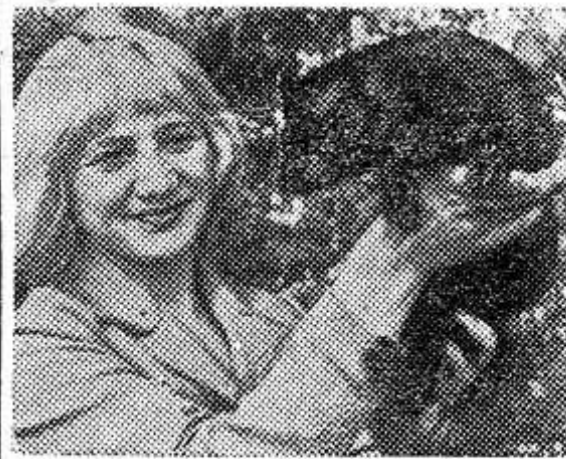
Курская область. Всеми цветами радуги играет 45-

тысячное семейство норки в Полевском зверосовхозе. Голубые, пастельные, перламутровые шкурки ценных зверьков — главная продукция хозяйства. В нынешнем году здесь будет выращено «мягкого золота» на 1,9 миллиона рублей.