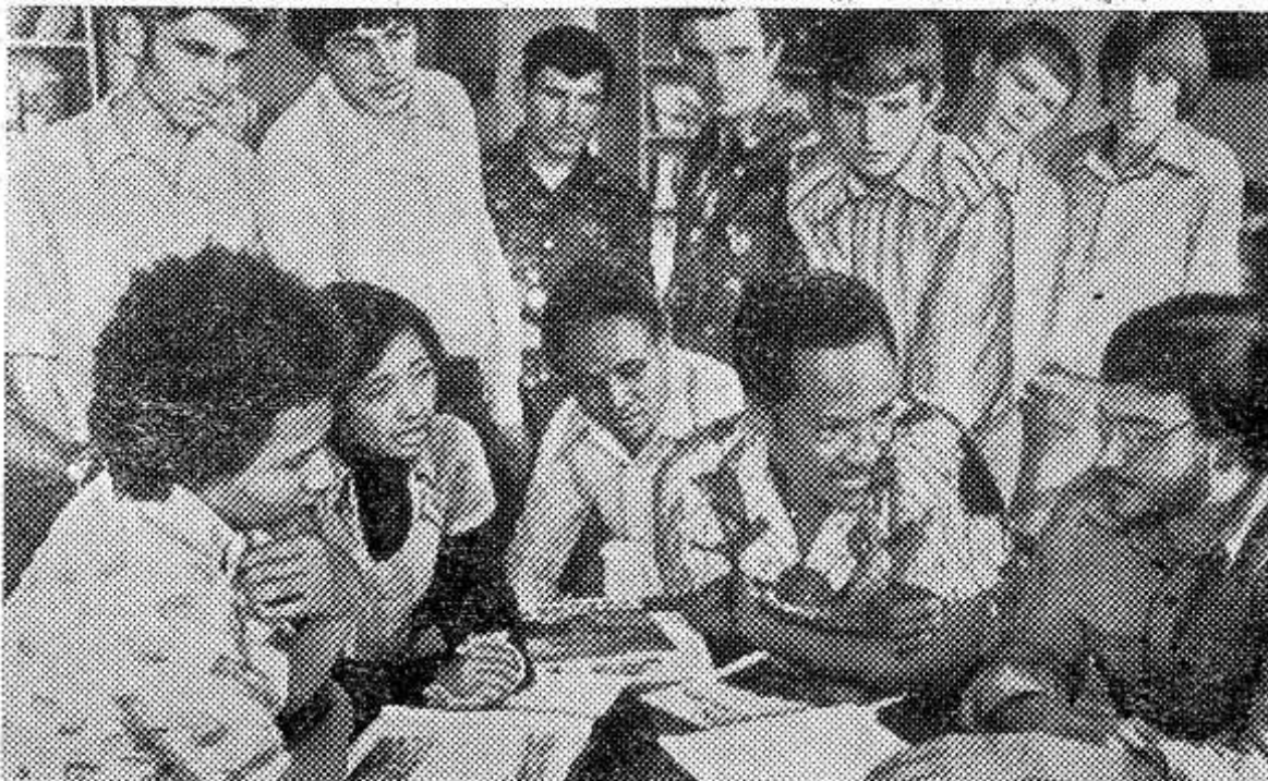
Молдавская ССР. В Цаульском агрономическом совхозе-техникуме имени В. И. Ленина учатся молда-

ване, украинцы, русские, болгары, гагаузы, юноши и девушки из стран Азии, Африки, Латинской Америки.