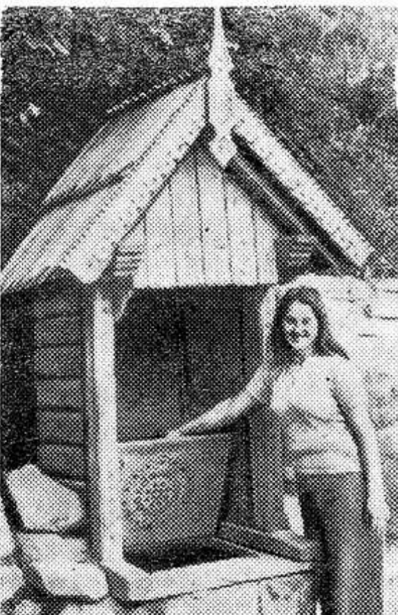
УКРАИНСКАЯ С С Р. Приветливо встречают туриста на трассах Буковины стилизованные, красочно оформленные колодцы. НА СНИМКЕ: колодец из дерева и камня.

Английская фирма «Виккерс океаник» построила подводную лодку из синтетических материалов. Ее длина 6,5 метра, и рассчитана она на трех человек. Подлодка будет обслуживать буровые установки, расположенные в открытом море. По расчетам конструкторов, срок эксплуатации новых подлодок из синтетических материалов на 10 лет больше, чем из стали, так как они не подвержены коррозии.