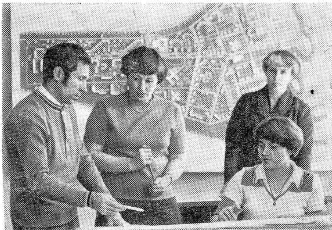
Орловская область. Орден «Знак почета» управление «Орелстрой», накопив опыт двухлетнего планирования и ритмичной сдачи жилья в городе, стало заниматься и сельским строительством. «Орловская непрерывка»

широким фронтом развернула строительные площадки на селе, а в институте «Орелгипрогосельстрой» уже разрабатываются очередные объекты, рассчитанные на четыре года вперед.