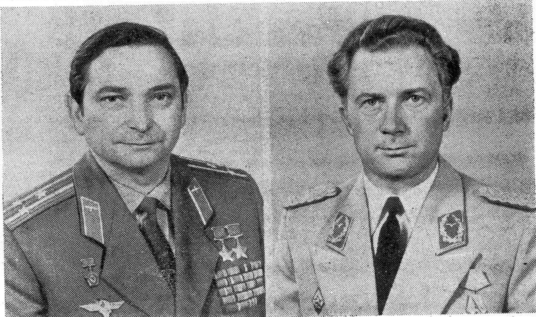
Командир международного экипажа космического корабля «Союз-31» летчик-космонавт СССР дважды Герой Советского Союза полковник В. Ф. Быковский. Космонавт-исследователь международного

По-прежнему вторую неделю труженики совхоза «Салют» удерживают лидерство в соревновании, убирая хлеба несколько быстрее, чем труженики совхоза «Глубоковский».