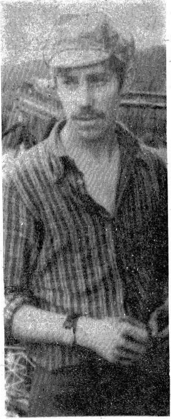
но, отвозит с полей солому, другая ведет косовицу подсолнечника. Солома и измельченная зеленая масса доставляются к траншеям. Четко спланированная работа двух крупных механизированных отрядов позволяет не только быстро вести жатву колосовых, но и пополнять запасы кормов.