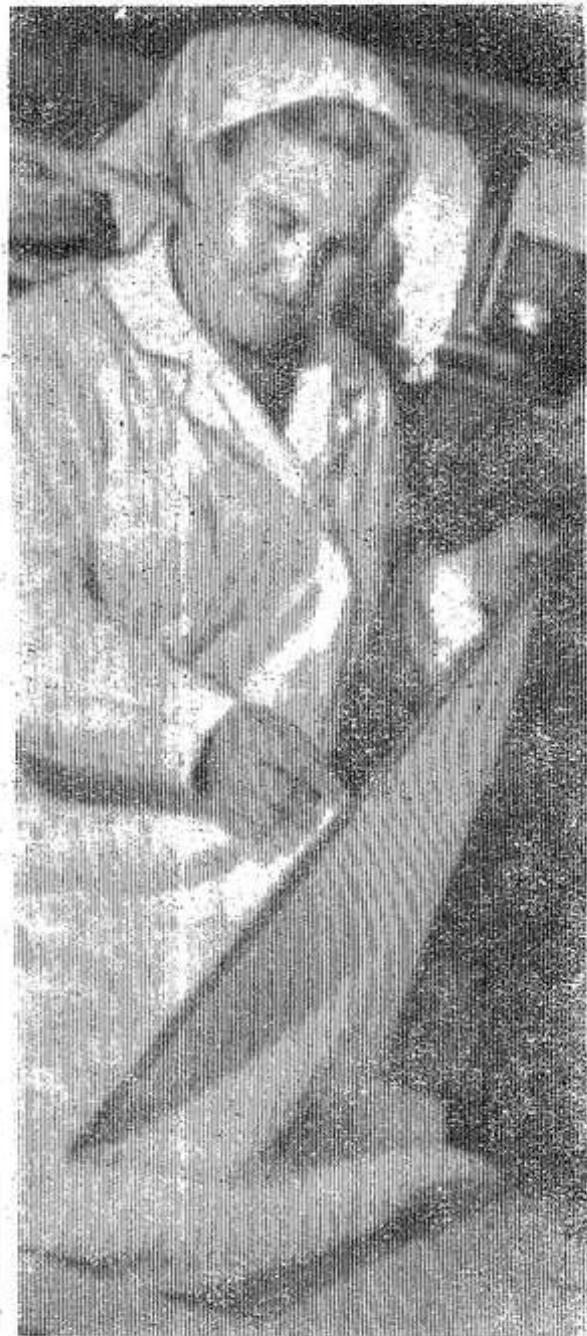
Услугами Ладыгинского сельского магазина пользуются многие покупатели населенных пунктов колхоза «Заветы Ленина». Здесь всегда можно найти товары первой необходимости, сделать заявку на покупку.

Пленум принял соответствующее постановление.