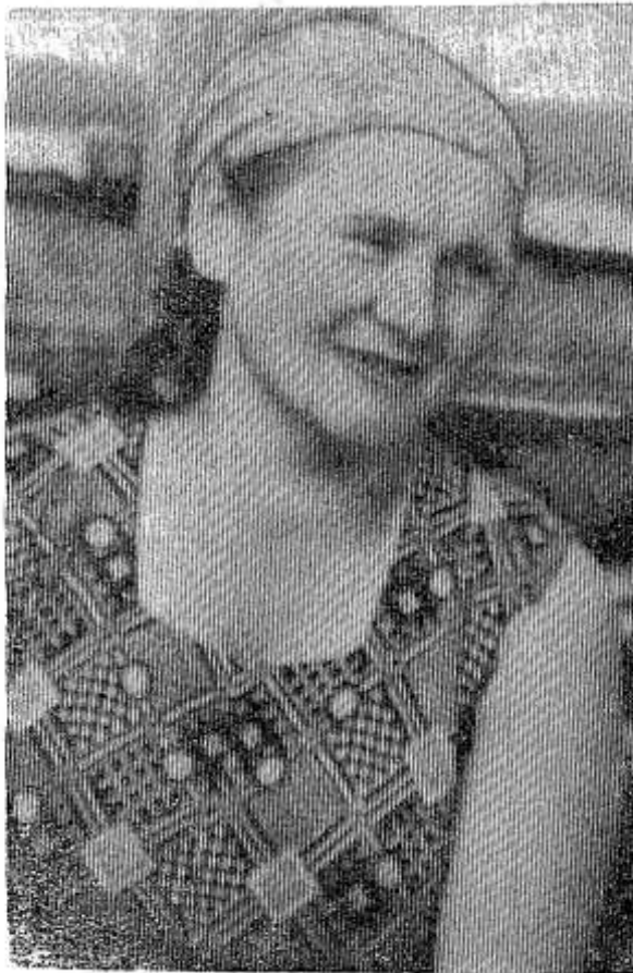
крупного рогатого скота.

Должное внимание уделяем санитарному состоянию помещения и выгородки. Регулярно и постоянно места нахождения животных чистим. Это, несомненно, тоже влияет на развитие молодняка