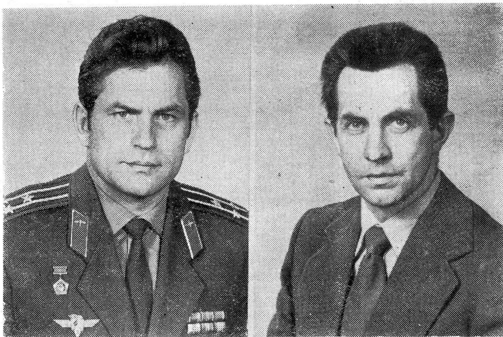
Восьмые сутки на околоземной орбите совершают космический полет Владимир Васильевич Коваленок и Александр Сергеевич Иванченков. 17 июня осуществлена стыковка космического корабля «Союз-29» со станцией «Салют-6», которая с 16 марта этого года совершала полет в автоматическом режиме. Космонавты т.т. Коваленок (на снимке слева) и Иванченков успешно выполняют заданную программу полета.