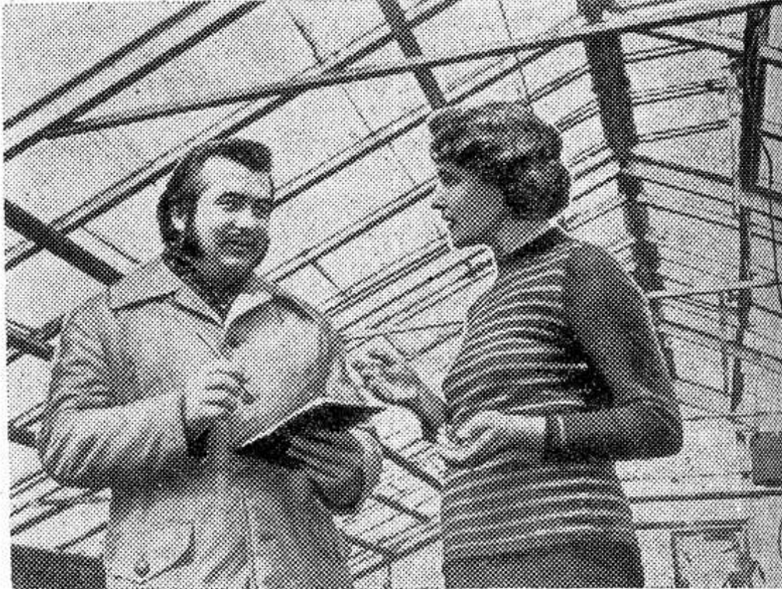
При Харьюском райкоме ЛКСМ Эстонии создан первый в республике клуб молодых депутатов.

Также принимаются конкретные меры по профилактическому осмотру других линий, по которым транслируются передачи.