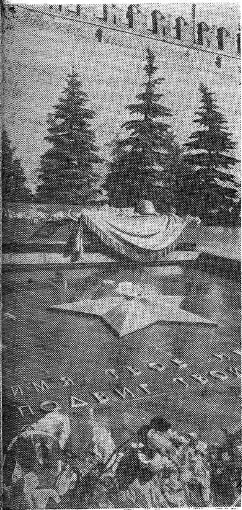
МОСКВА. У могилы Неизвестного солдата.

С Праздником Победы, дорогие товарищи! РАЙКОМ КПСС ИСПОЛКОМ РАЙСОВЕТА