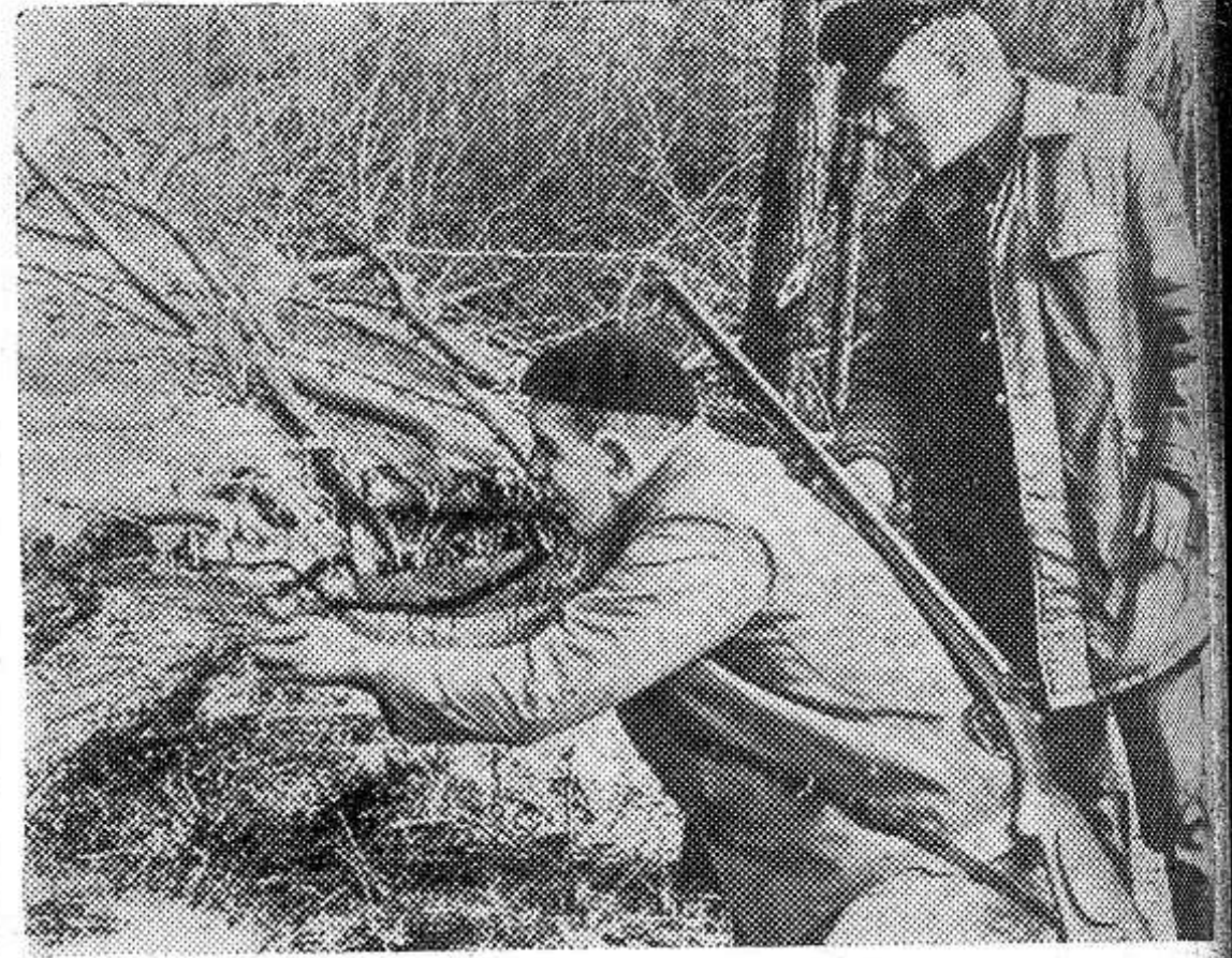
БОЛГАРИЯ. Егери охотничьих угодий круглый год заботятся о своих подопечных. Они регулярно подкармливают свейжий корм в специально отведенные места, ведут борьбу с браконьерами. НА СНИМКЕ: егери Русенского округа наполняют кормушки.

В. БОГДАНОВ, главный инженер эксплуатационно-технического узла связи.