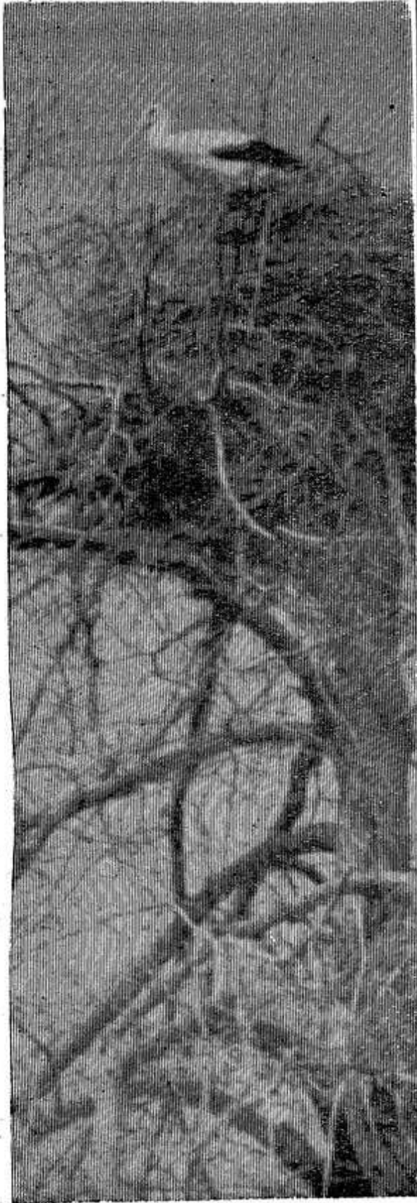
И к нам пришла весна. Фотоэтиюд Ю. Орлова.