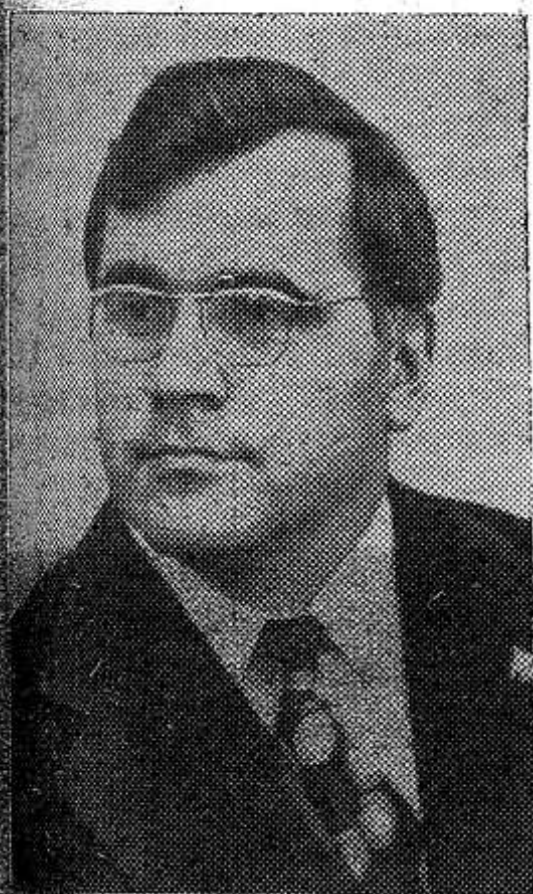
Маслухов Борис Николаевич — Первый секретарь ЦК ВЛКСМ.

МОСКВА. (ТАСС). В Кремлевском Дворце съезд Всесоюзного Ленинского Коммунистического Союза Молодежи. Представители почти 38-миллионного отряда советской комсомолы с чувством большой ответственности и глубокой заинтересованности обсуждали важнейшие проблемы, связанные с участием молодежи в коммунистическом строительстве.