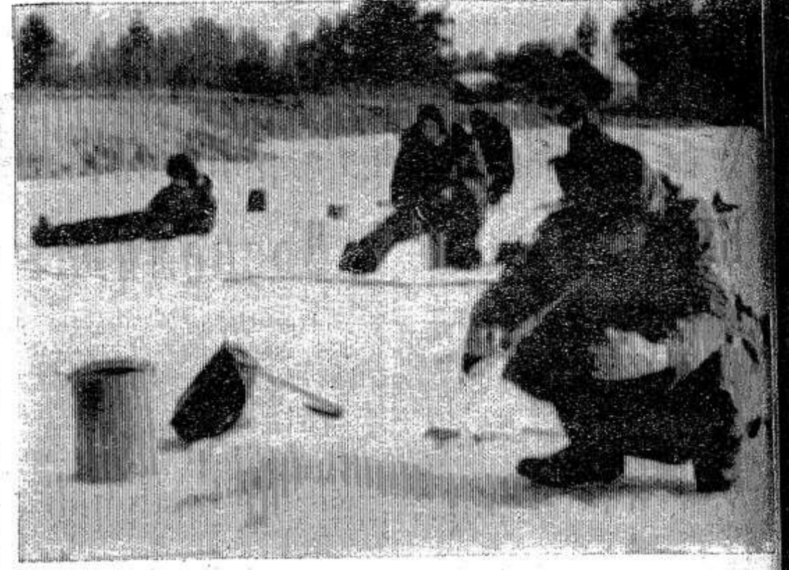
Последний подледный лов. Фотоэтиюд Ю. Орлова.

Встала в строй и раненых Выносила в тыл с передовой. Всех спасенных ею было А себя она не сберегла. Над ее оборванной дорогой Красная гвоздика расцвела.