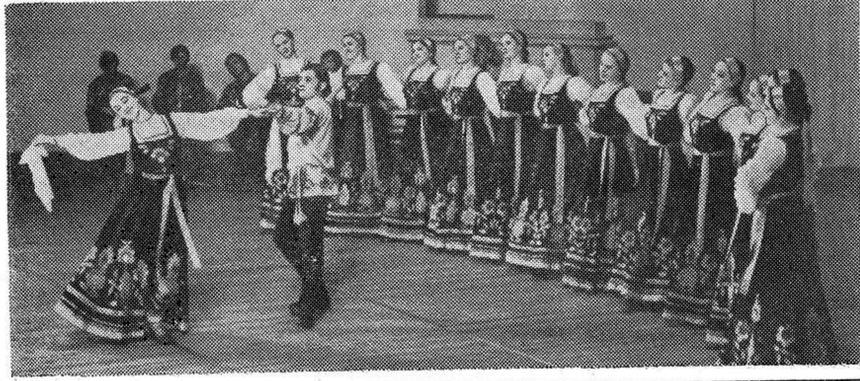
Служба охраны правопорядка сообщает