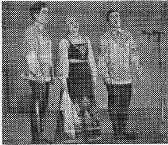
На нижнем снимке: танец «Как за нашим за двором» в исполнении ансамбля.

На верхнем снимке: выступают артисты ансамбля «Русь» Владимирской областной филармонии. Исполняется русская народная песня «Не орел с лебедем купалися».