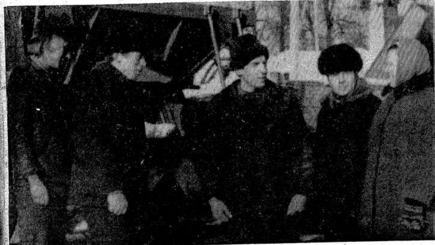
НА СНИМКЕ: идет проверка готовности техники к весеннему севу.

Рабочий план обсужден и принят на общем собрании механизаторов, бригадиров и специалистов по растениеводству.