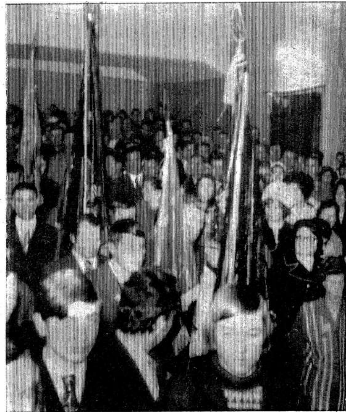
На сцену вносятся знамена трудовой славы.