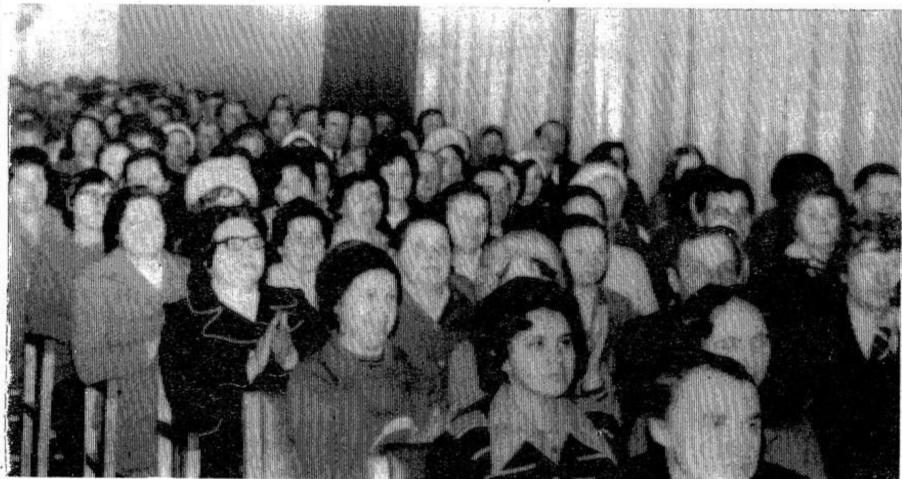
В зале заседания — передовики соревнования.

В заключение докладчик говорит о задачах тружеников сельского хозяйства, о своевременной подготовке к весеннему севу, выражает уверенность, что труженики города и села успешно справятся с обязательствами третьего года десятой пятилетки.