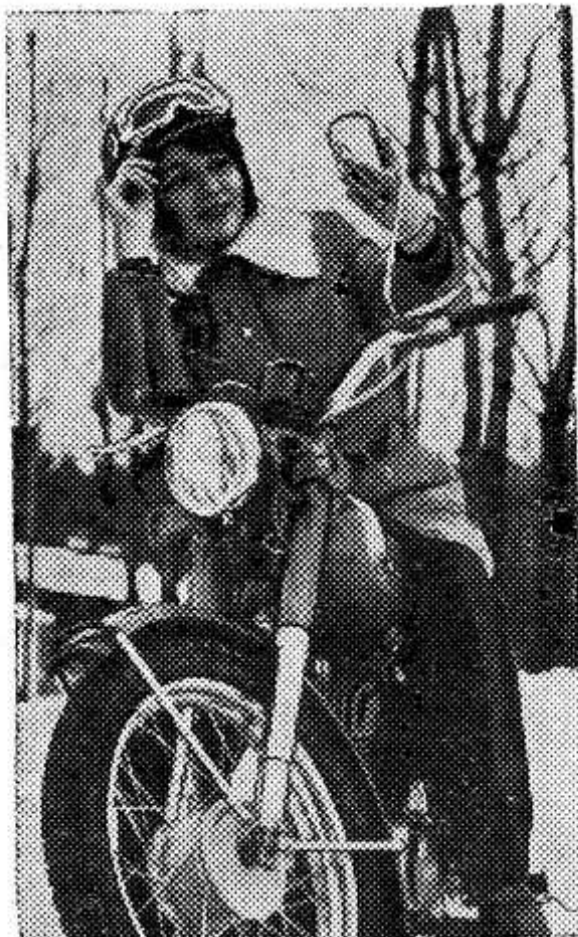
Белорусская ССР. Дорожный мотоцикл ММВЗ-3,115, выпускаемый Минским мотовелозаводом.