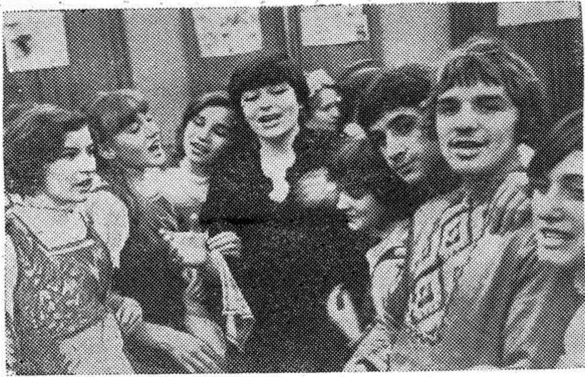
триотический рассказ о Родине. НА СНИМКЕ: преподава-

Фестиваль, в котором участвовали 250 ребят, вылился в взволнованный, па-