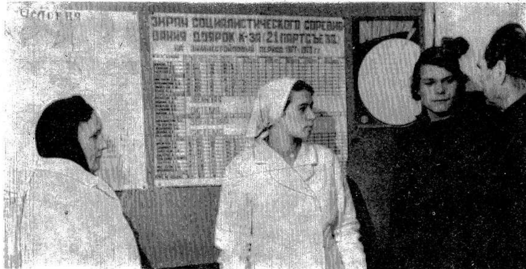
Второй год действует новая животноводческая ферма в Аристове колхоза «XXI партсъезд». Здесь трудится дружный коллектив доярок, скотников, кормораздатчиков. НА СНИМКЕ: в красном уголке фермы