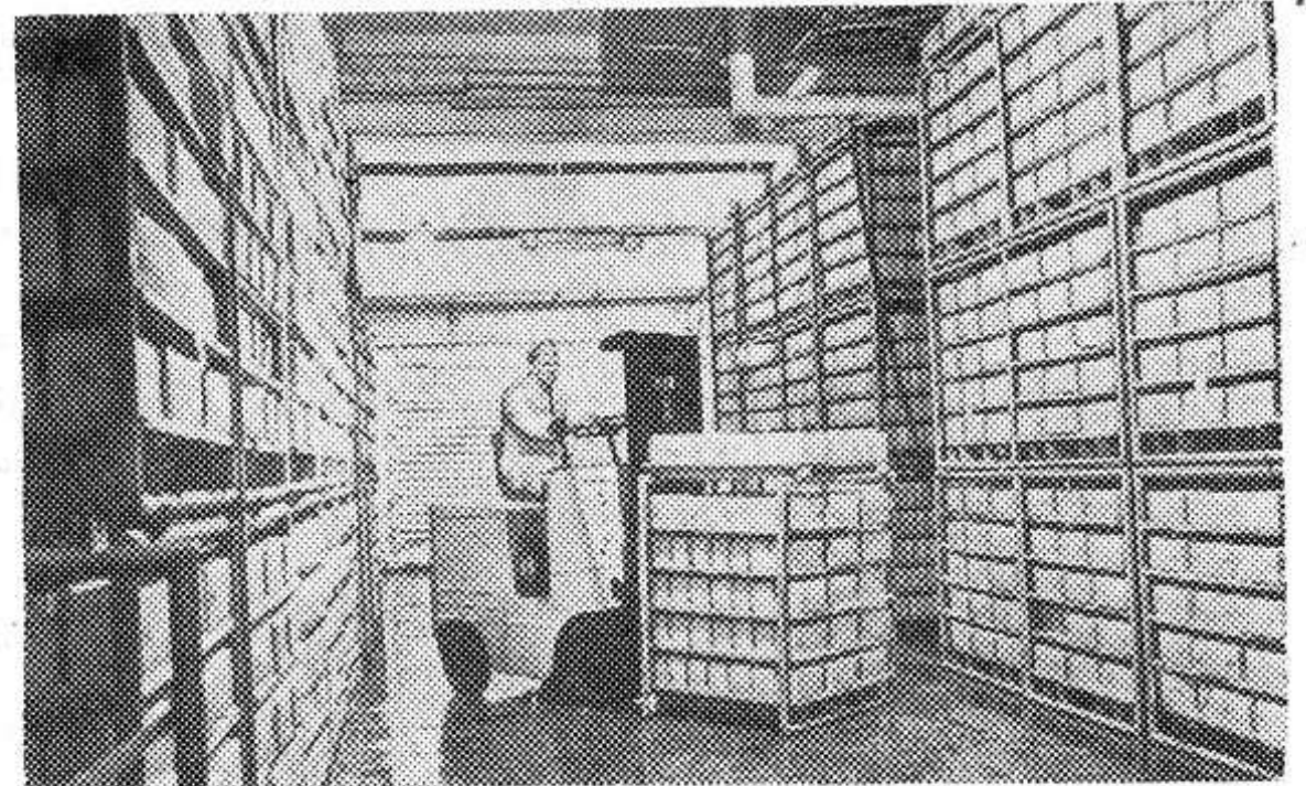
ЛАТВИЙСКАЯ ССР. На 300 тысяч рублей сверхплановой продукции выпущено с начала года коллективом Валмиерского молочного комбината Предприятие четыре квартала подряд удерживает переходящее Красное знамя Министерства мясной и молочной промышленности СССР и ЦК профсоюза рабочих пищевой промышленности. НА СНИМКЕ: камера для созревания сыров.