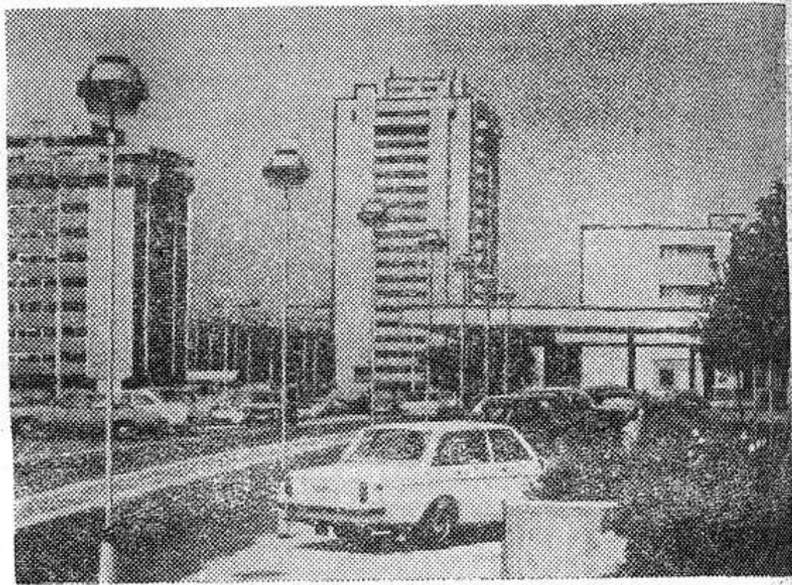
Самым крупным районом югославской столицы является Новый Белград (на снимке). По существу это целый город, насчитанный на 250 тысяч жителей.

серым разбойникам. На днях бителя Анатолия Григорьевича Иванова. И. ПЕТРОВ, охотовед.