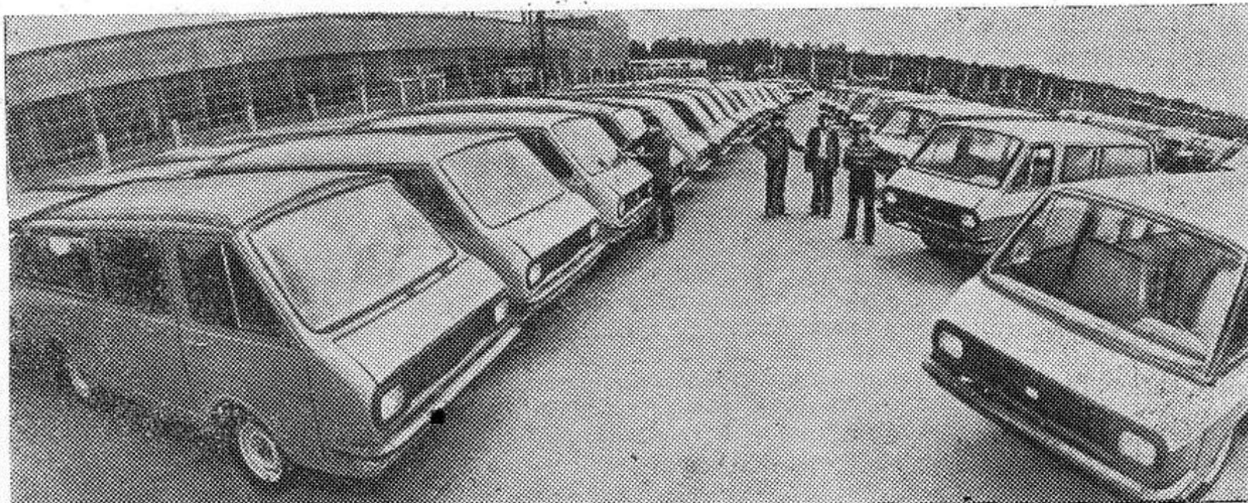
Латвийская ССР. Елгавский завод микроавтобусов имени XXV съезда КПСС.

«ЭР» и «ДР» (электропоезд и дизель-поезд рижские) — марки, хорошо известные. Латвия снабжает этими видами железнодорожного транспорта всю страну. В десятой пятилетке семейство электричек пополняется новыми моделями.