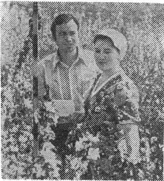
Коллектив научно-производственного объединения «Кодру» занимается выведением высокоурожайных сортов плодовых культур, создает новые

сельскохозяйственные машины и механизмы, разрабатывает промышленную технологию ухода за многолетними насаждениями.