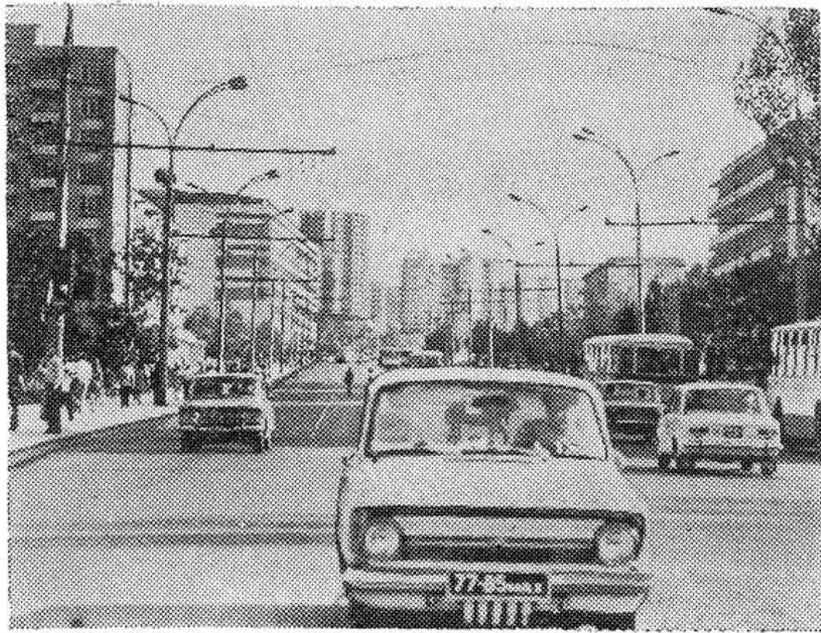
Столица Молдавской ССР — Кишинев. НА СНИМКЕ: улица Тимошенко, связывающая старую часть города с новыми микрорайонами.