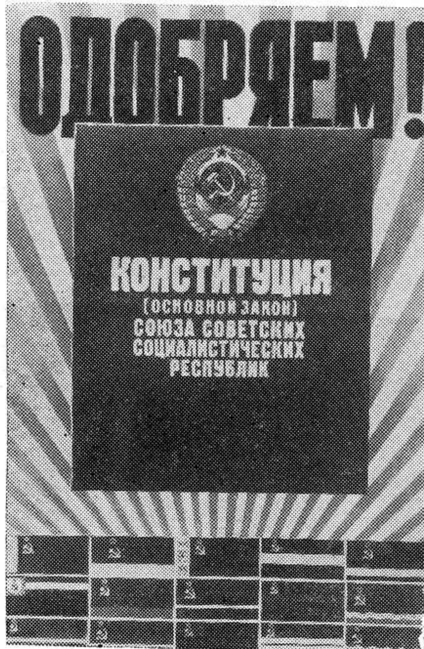
Плакат художника Ю. Кершина, Издательство «Плакат».

В проекте новой Конституции СССР говорится: «Местные Советы народных депутатов решают все вопросы местного значения, исходя из общегосударственных интересов и интересов граждан, проживающих на территории Совета, проводят в жизнь решения вышестоящих государственных органов, а также участвуют в обсуждении вопросов республиканского и общесоюзного значения, вносят по ним свои предложения».