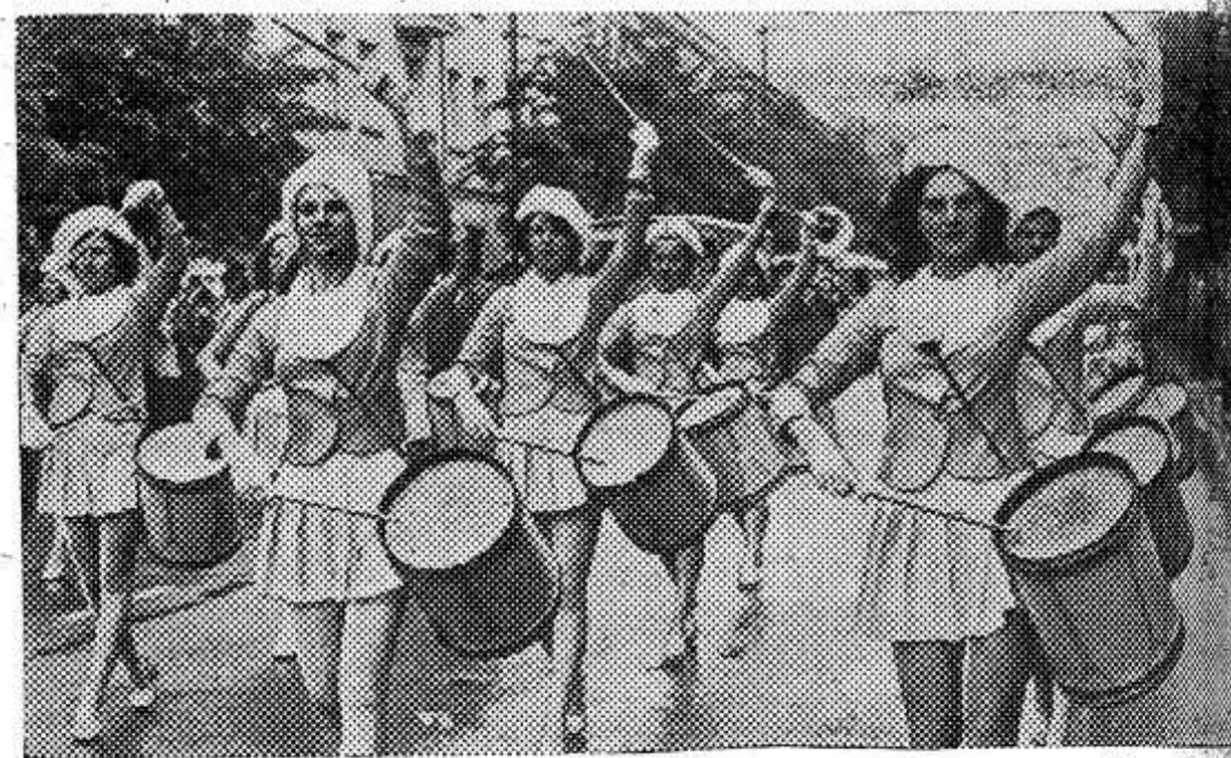
Литовская ССР. Праздник духовых оркестров в Клайпеде открывают барабанщицы из оркестра Клайпедской консерватории.