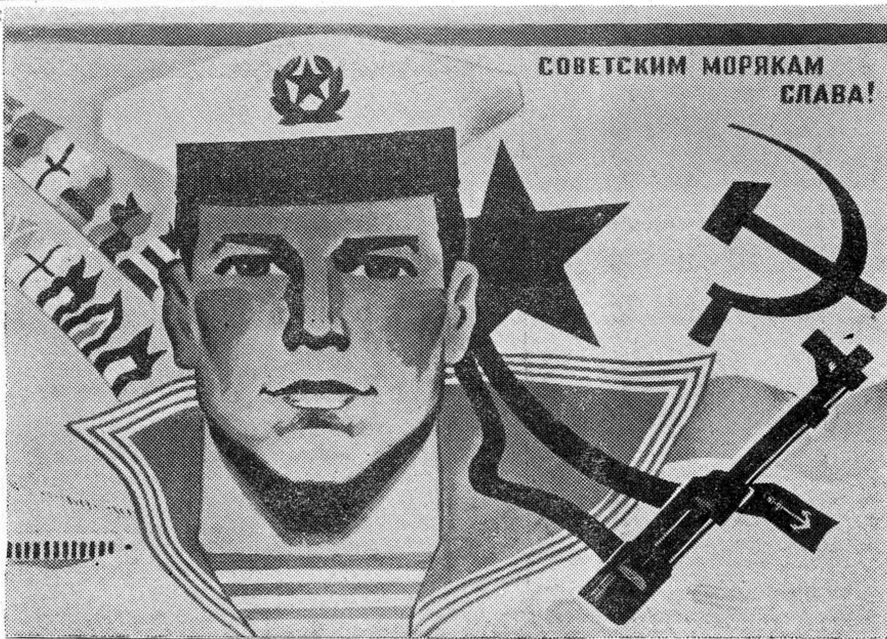
Плакат художника И. Коминарца. Издательство «Плакат».