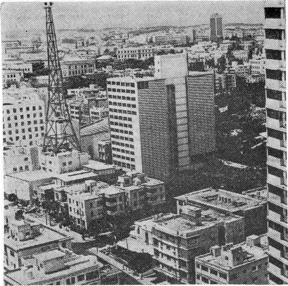
Гавана — крупнейший промышленный, культурный и научный центр столицы Республики Куба.