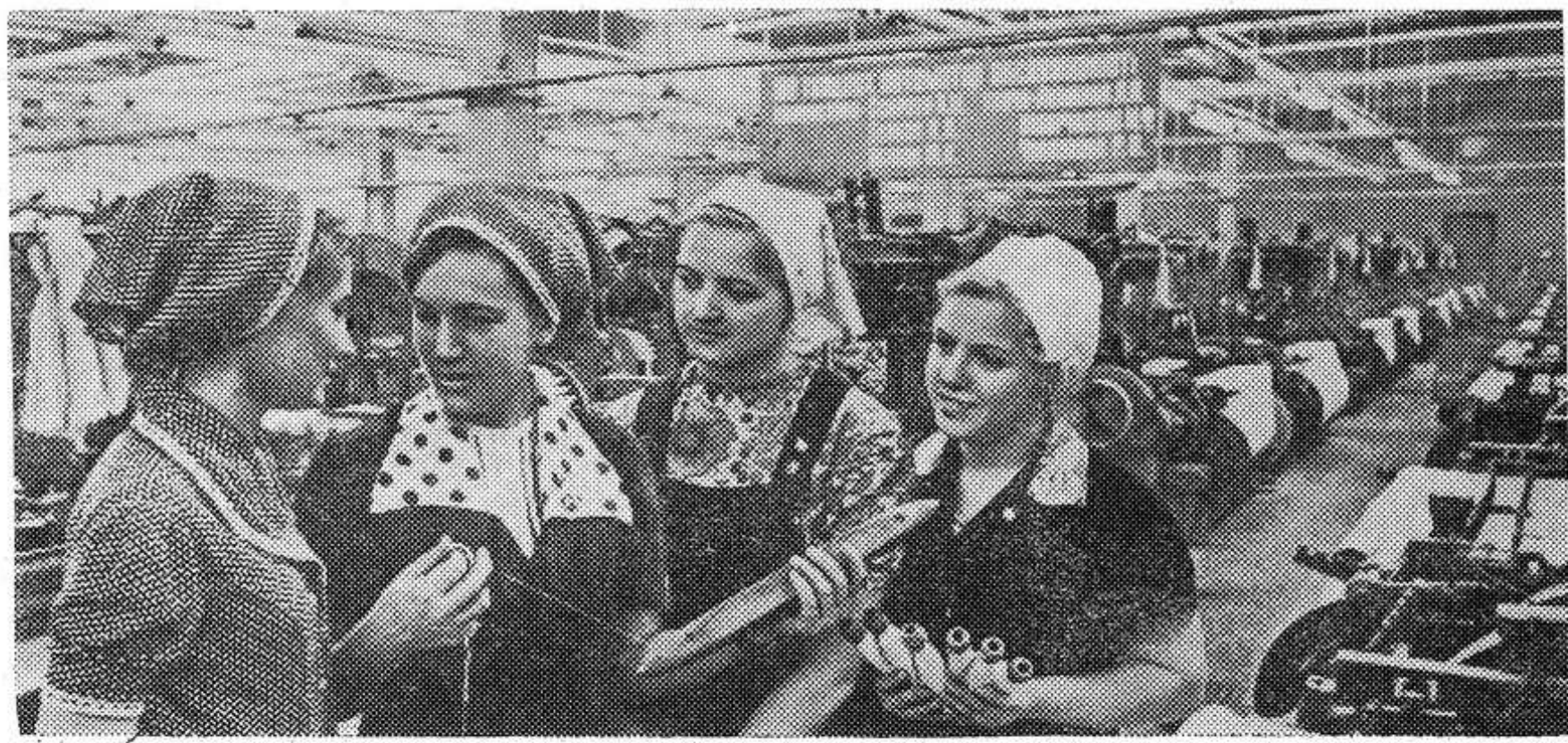
Ивановская область. К 7 ноября на родниковском меланжевом комбинате «Большевик» будет введен в строй на полную мощность новый цех ткацкого производства. Сейчас уже 150 станков дают продукцию.

М. ИВАНОВ, главный инженер спецавтопредприятия.