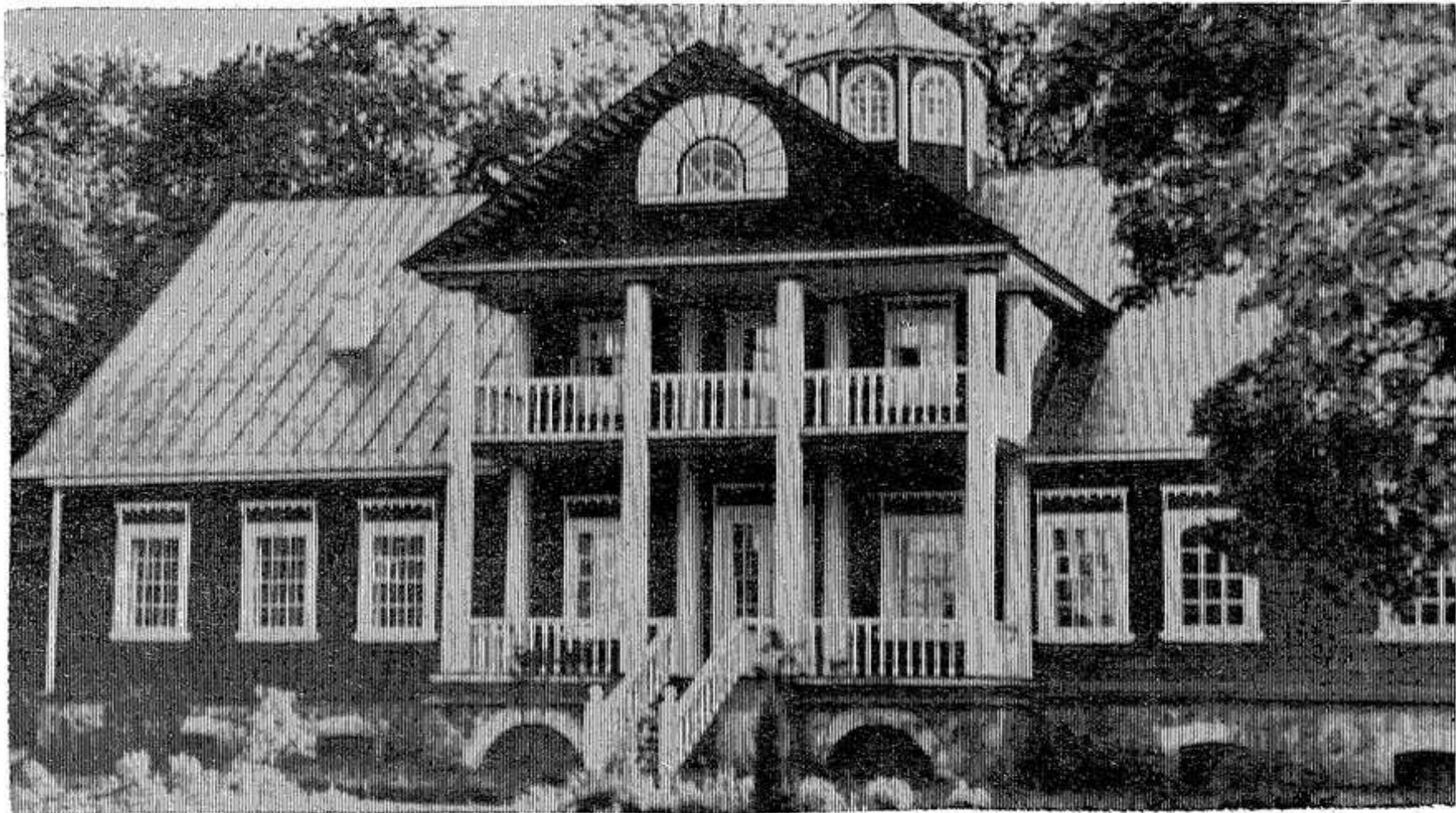
Дом Ганнибалов в Петровском, восстановленный в мае 1977 года.