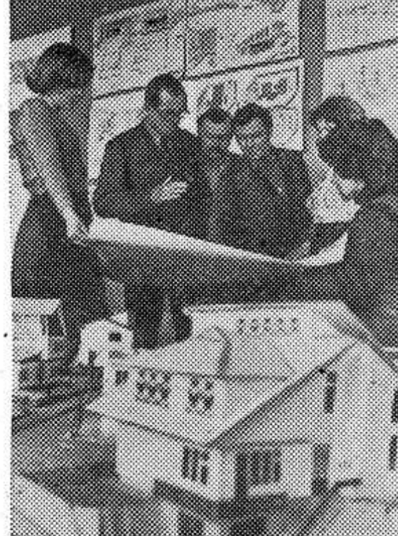
УКРАИНСКАЯ ССР. Широкая программа экономического и социального развития предусматривает постепенное приближение условий труда, отдыха и быта сельских тружеников к городским.