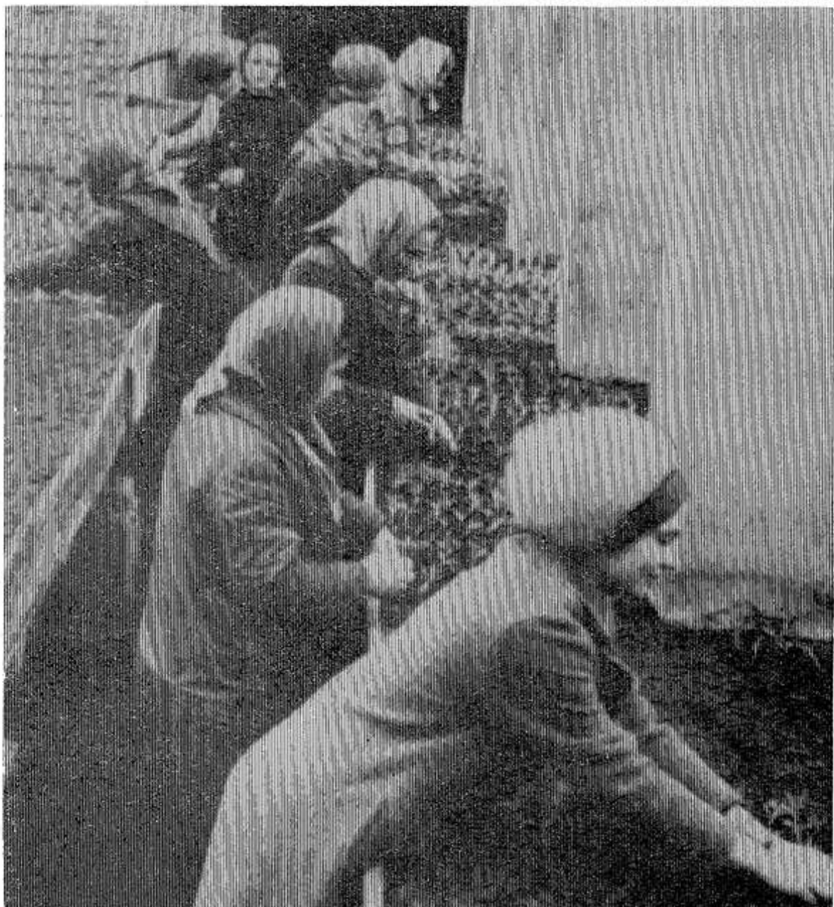
НА СНИМКЕ: пикировка рассады помидоров в подсобном хозяйстве универсального торгова. Каждый из 20 работающих высадил по 1000 растений.