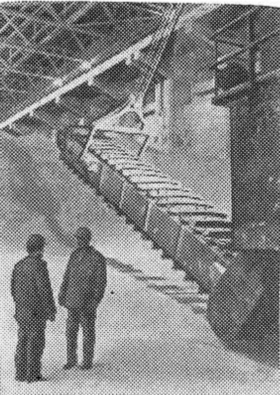
Тулльская область. Коллектив Щекинского производственного объединения «Азот» имени 50-летия СССР обязался завершить программу второго года десятой пятилетки по выпуску минеральных удобрений досрочно и дать

сверх плана 15 тысяч тонн продукции. На предприятии широко развернулось социалистическое соревнование за достойную встречу 60-летия Великого Октября.