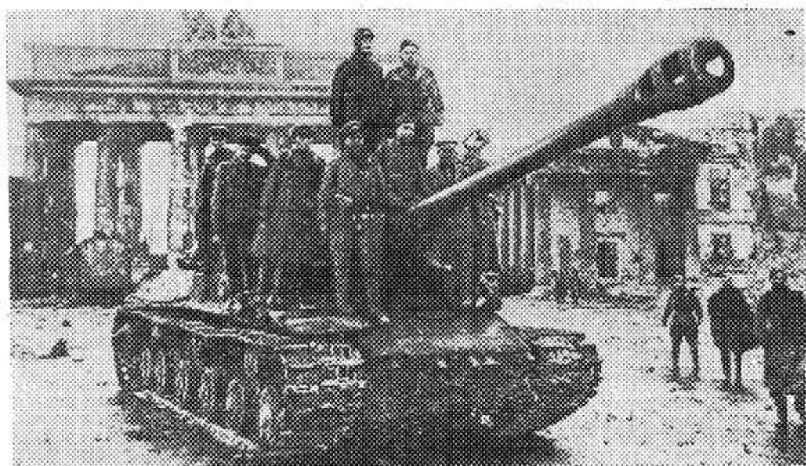
Советские танки у Бранденбургских ворот. Берлин. 4 мая 1945 года.