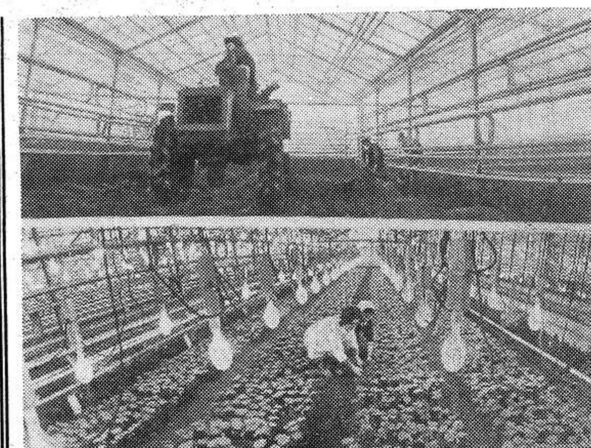
БРЯНСКАЯ ОБЛАСТЬ. Еще три гектара закрытого грунта приобавилось в теплицах совхоза «Культура» Брянского района. С вводом в эксплуатацию этих площадей полностью вошла в строй первая очередь тепличного комбината мощностью 1840 тонн зеленой продукции в год.

— Как чувствует себя заряжающий? К бою готов?