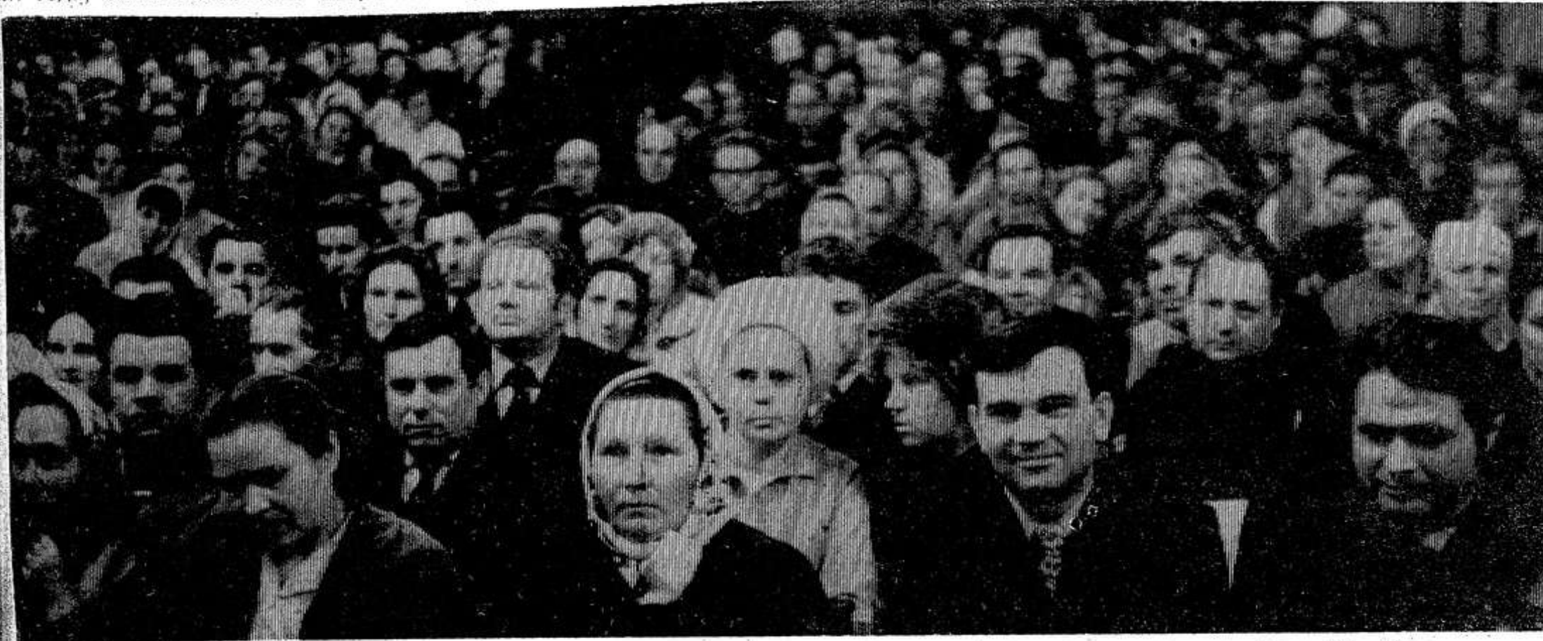
НА СНИМКЕ: в зале заседаний.

По окончании средней школы я решил получить профессию сельского механизатора. Работать буду в родном совхозе. Призываю всех сверстников последовать моему примеру.