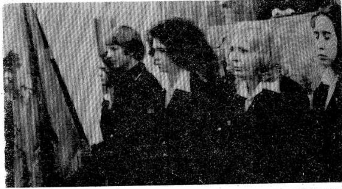
Под звуки оркестра в зал, входит группа учащихся Опочецкого профтехучилища. Они приветствуют участников слета. Славят передовиков производства, называя имена механизаторов, животноводов, строителей промышленных предприятий.

Закончился слет передовиков промышленности и сельского хозяйства праздничным концертом.