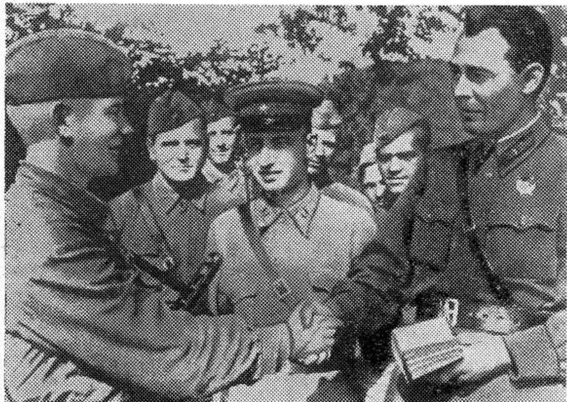
Сентябрь 1942 года, время боев за Туапсе. Бригадный комиссар Л. И. Брежнев беседует с солдатами. Только что он вручил одному из них — Александру Малову — партийный билет.

Приведенные в книге материалы ярко и убедительно еще раз подчеркивают, что советский народ монолитно сплочен вокруг Коммунистической партии, ее Центрального Комитета, Политбюро. (ТАСС).