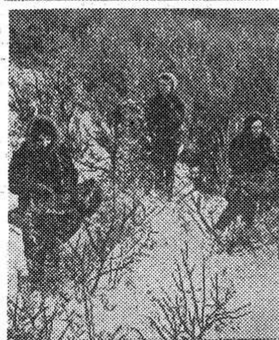
На юге Бурятии в совхозе «Облепиховый» идет сбор облепихи.

Сибирским бальзамом называют эту ягоду. Плоды ее богаты витаминами и используются для приготовления вкусного сока и лекарственного масла.