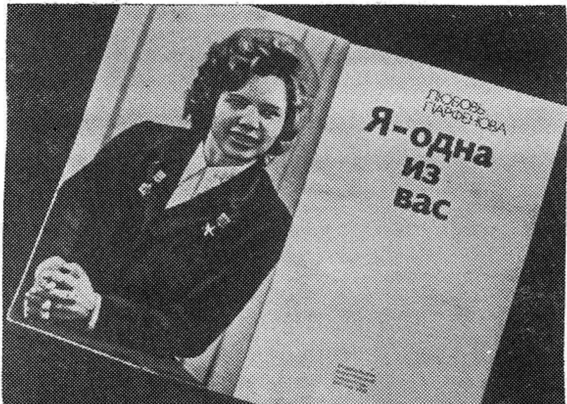
Я — одна из вас