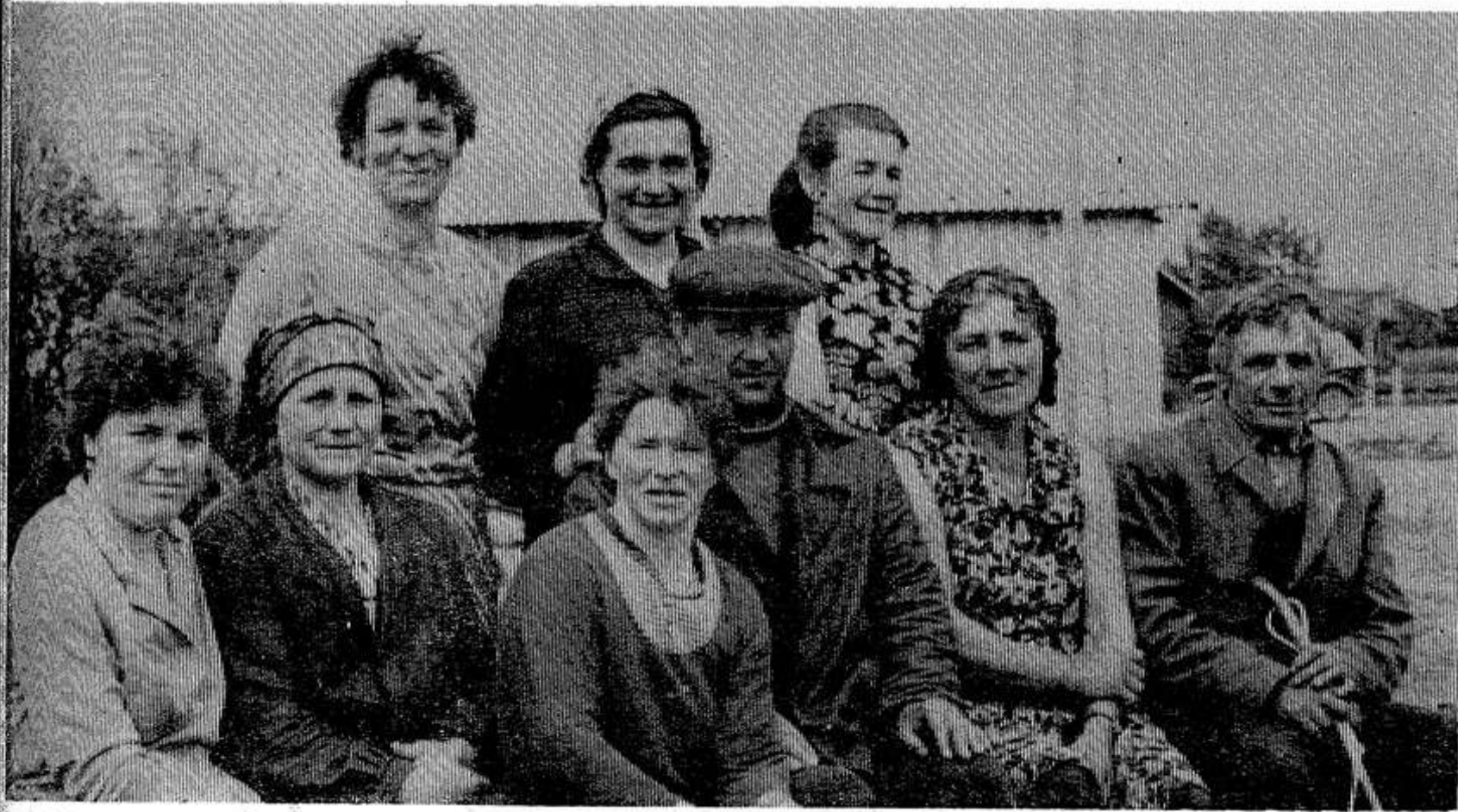
Ферма Буколово — передовая в колхозе «Красный Октябрь». Средний надой от коровы составил по 1936 килограммов, а некоторые доились свыше двух тысяч. Надой возросли по сравнению с этим же периодом прошлого года на 32 килограмма.