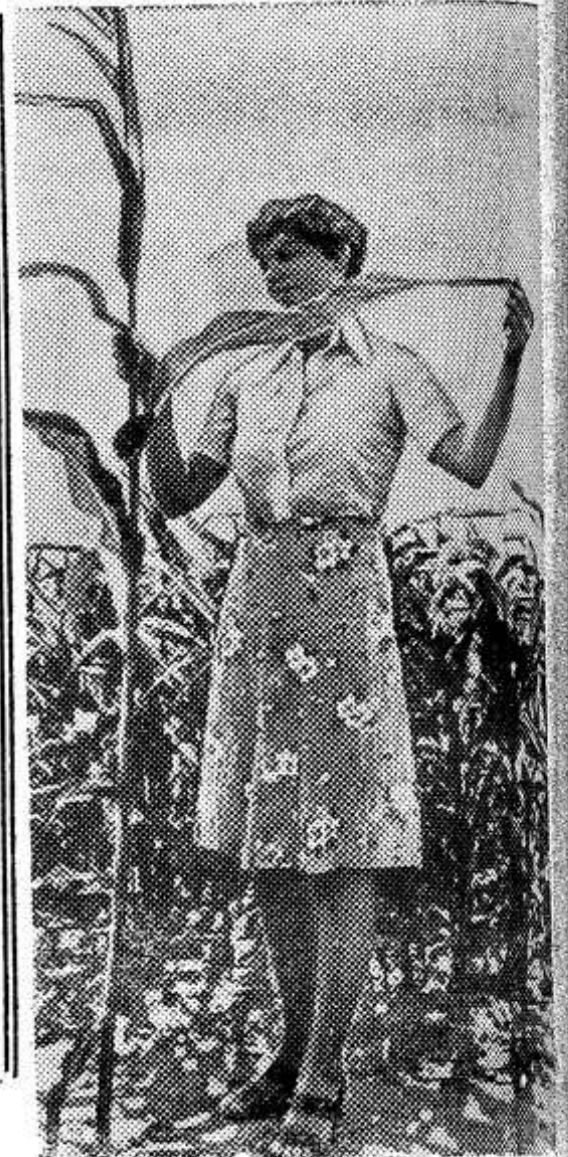
чающая подогрев от ТЭС в Нойрате.