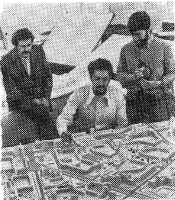
На завершившемся в Москве Всесоюзном конкурсе проектов сельских Домов культуры для Нечерноземной зоны РСФСР первое место раздели-

ли московские архитекторы и авторский коллектив института «Ленпроект» из города на Неве.