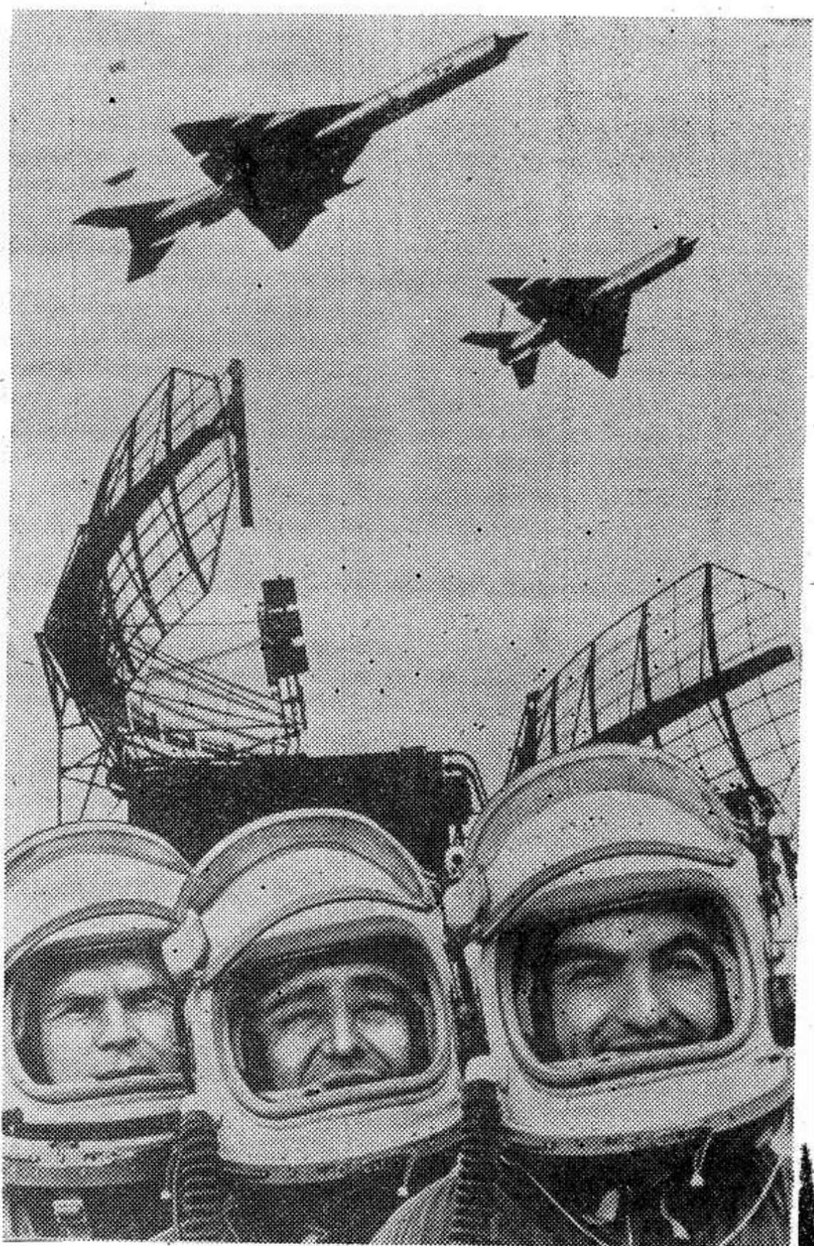
Слава советской авиации!