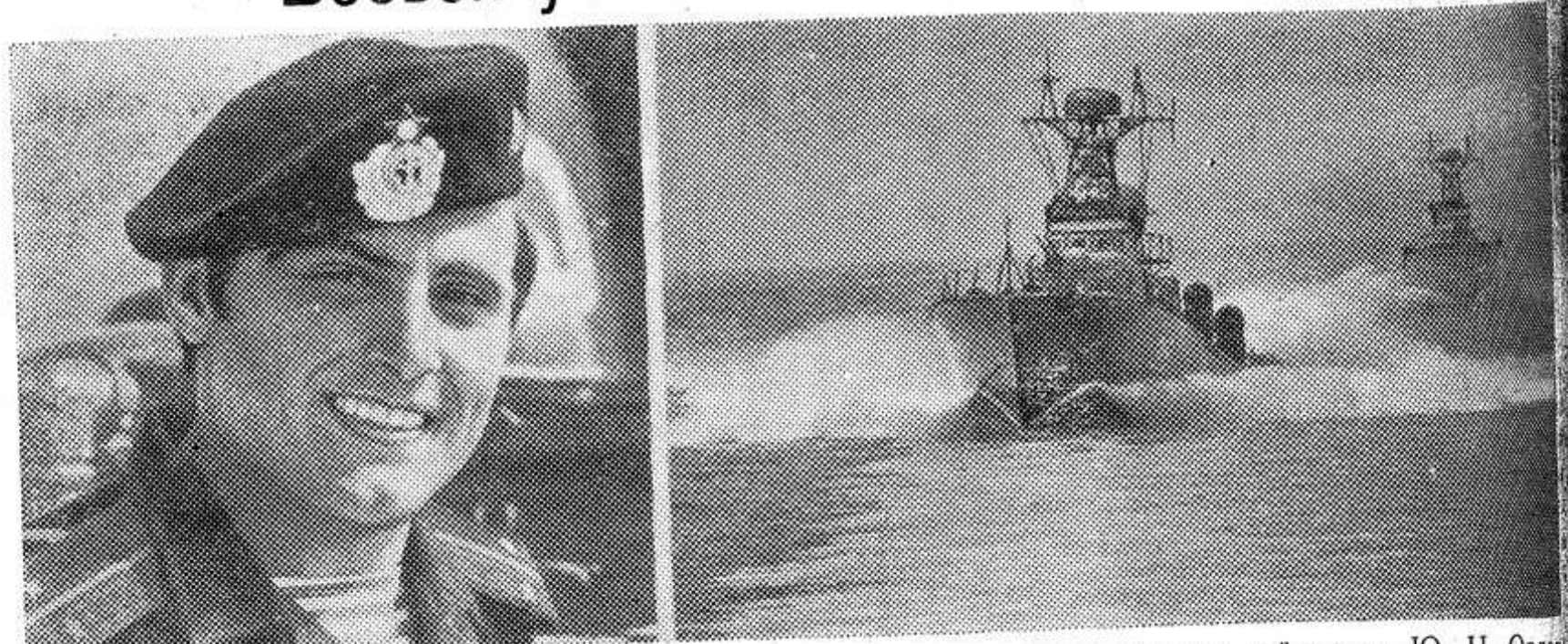
В частях и на кораблях Краснознаменного Черноморского Флота в напряженном темпе идет летняя боевая учеба. НА СНИМКАХ: командир отличного танкового

Один из таких кораблей — «Адмирал Зозуля». О нем, о его экипаже рассказывается ниже.