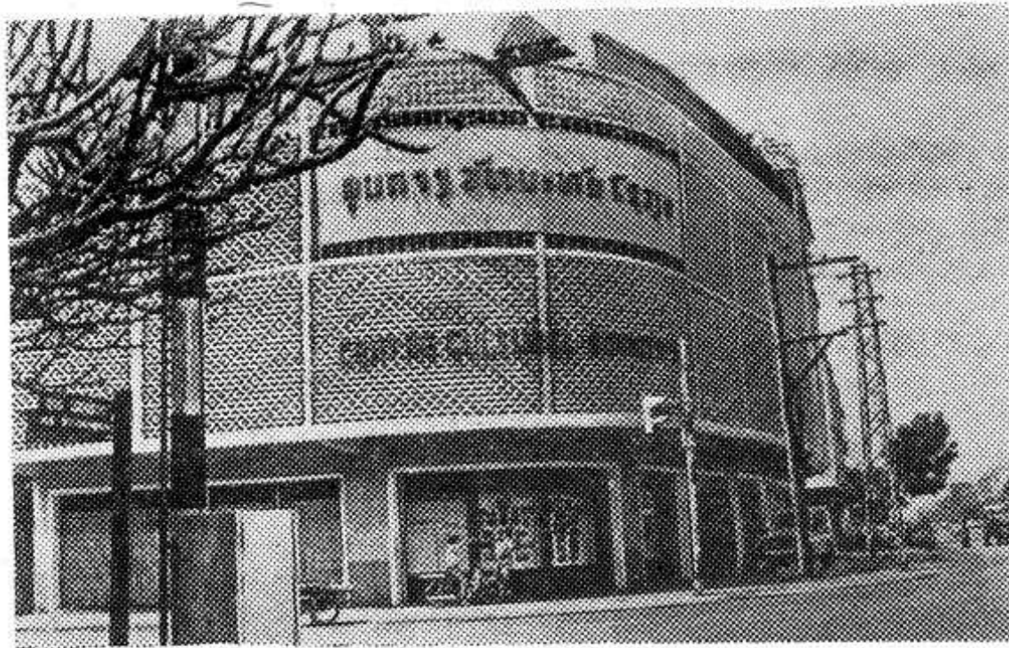
Столица Лаосской Народно-Демократической Республики — город Вьентьян.

НА СНИМКЕ: здание советского культурного центра.