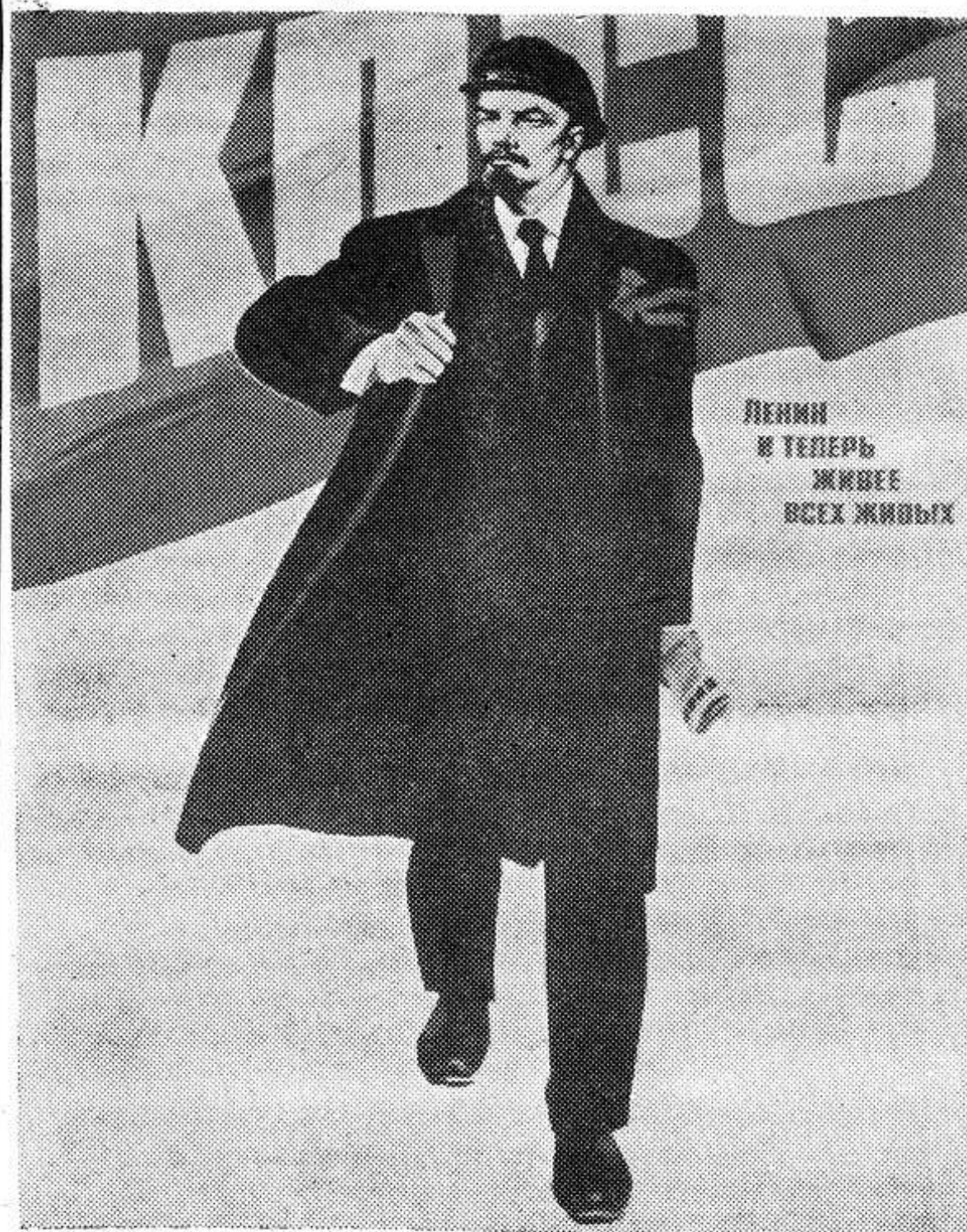
ЛЕНИН И ТЕПЕРЬ ЖИВЕЕ ВСЕХ ЖИВЫХ