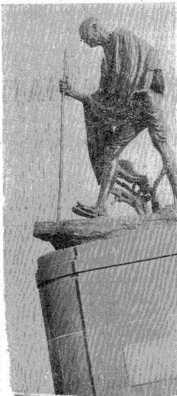
Памятник выдающемуся деятелю национально-освободительного движения Индии Махатме Ганди.

С 1956 года проходит обмен туристами между СССР и дружественными нам Индией и Цейлоном. Недавно такую туристическую поездку в эти страны впервые организовало бюро иностранного туризма Псковского обкома профсоюза.