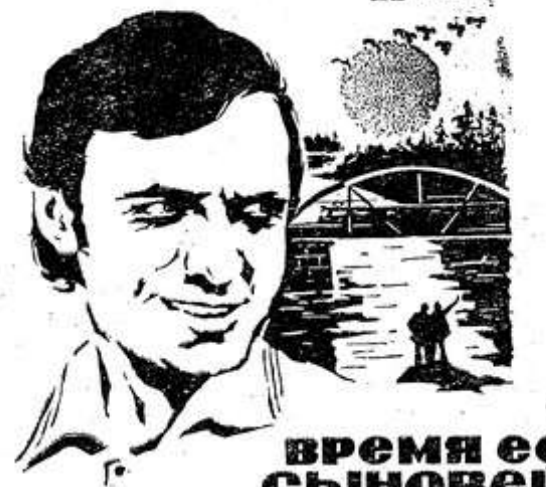
ВРЕМЯ ЕЕ СЫНОВЕЙ

Действие происходит в небольшой, ничем не примечательной деревне, каких много в Белоруссии, ранней весной, когда солнечный свет щедро заливает землю. В семье Гуляевых праздник — встретились вместе четверо братьев.