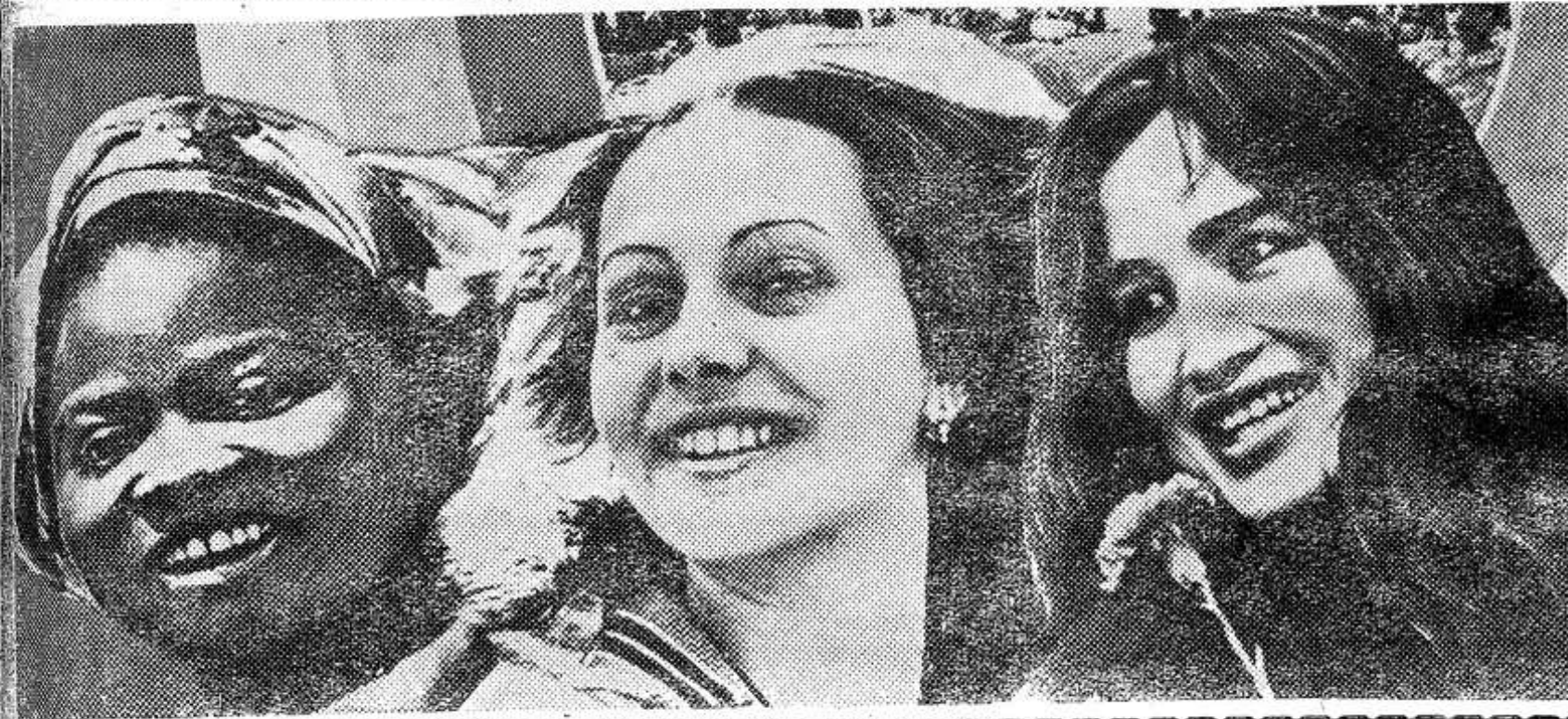
ПРОЛЕТАРНИ ВСЕХ СТРАН, СОЕДИНЯЙТЕСЬ!

анизатора ра зам, редактор 7, бухгалтер ам. полиграфии