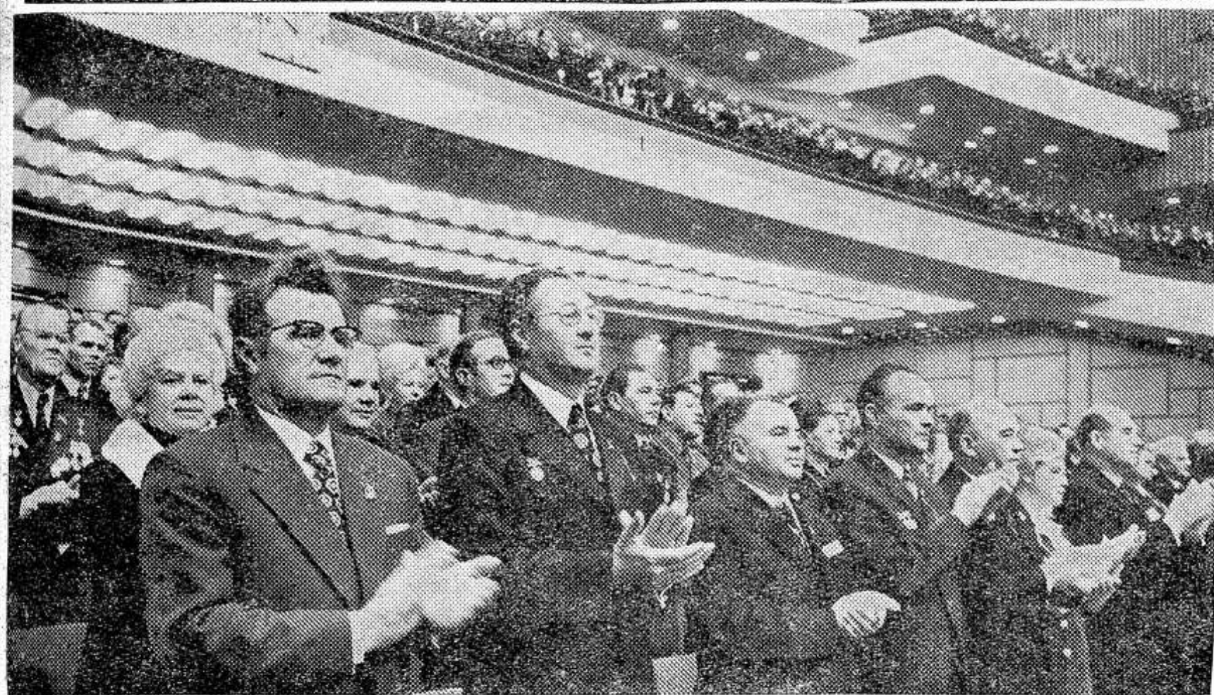
МОСКВА. 24 февраля в Кремлевском Дворце съездов открылся XXV съезд КПСС.