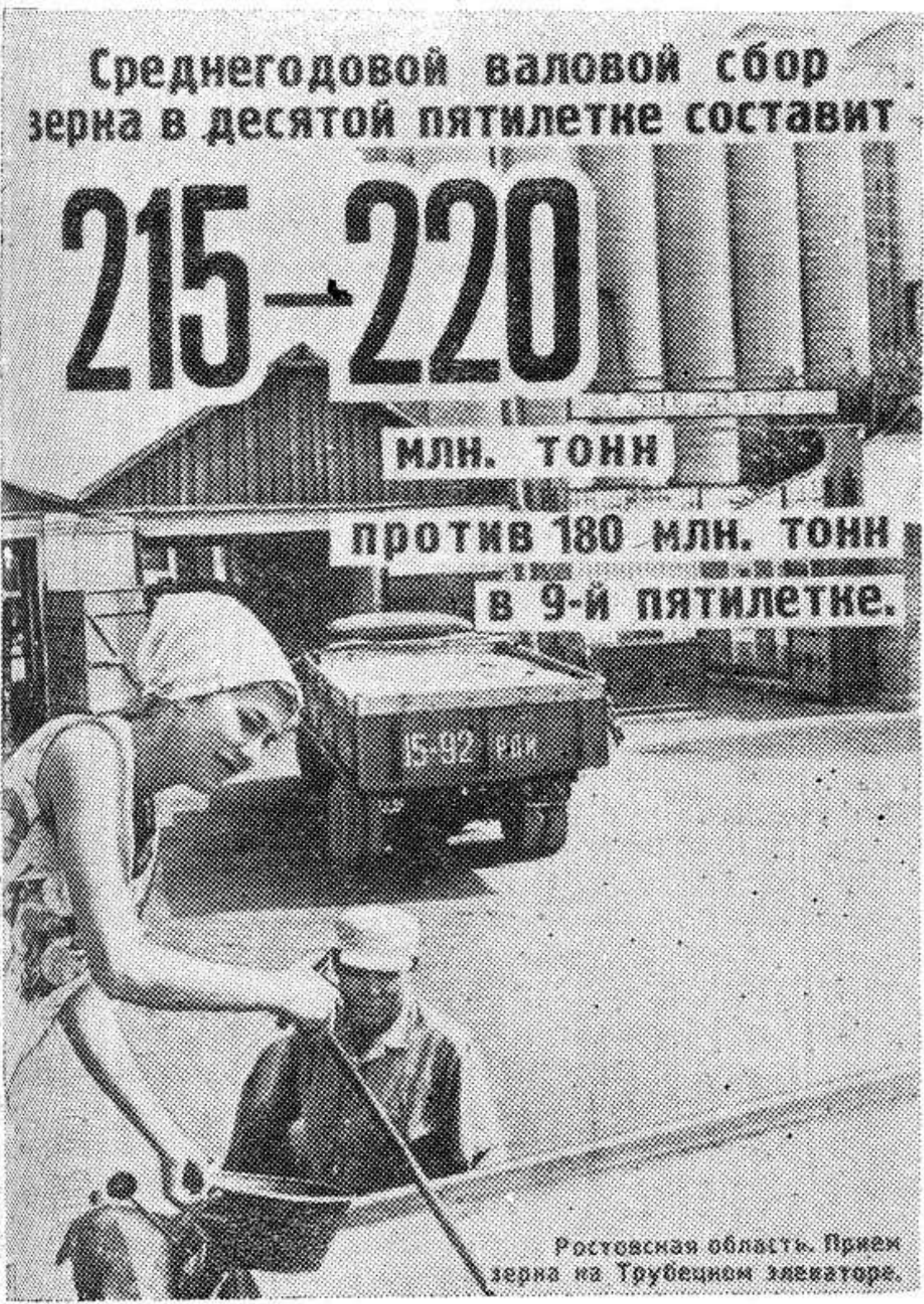
Ростовская область. Прием зерна на Трубцевском элеваторе.