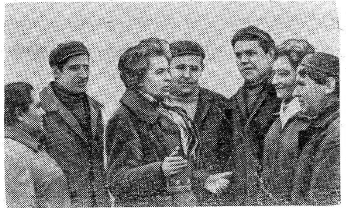
ного конгресса, посвященного Международному году женщины, который проходил в Берлине.

Э. Блажевичюте считается сейчас одним из лучших организаторов сельскохозяйственного производства в республике. Она — член ЦК КП Литвы, депутат райсовета. В составе советской делегации участвовала в работе Всемир-