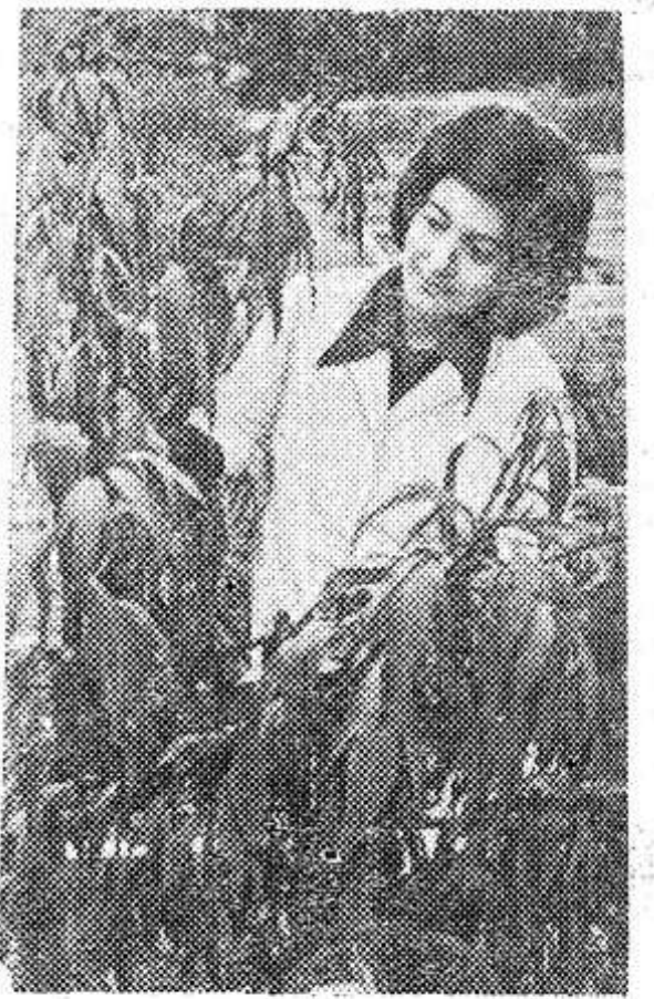
площадью 3000 квадратных метров.

На нижнем снимке: новые теплицы института полезной