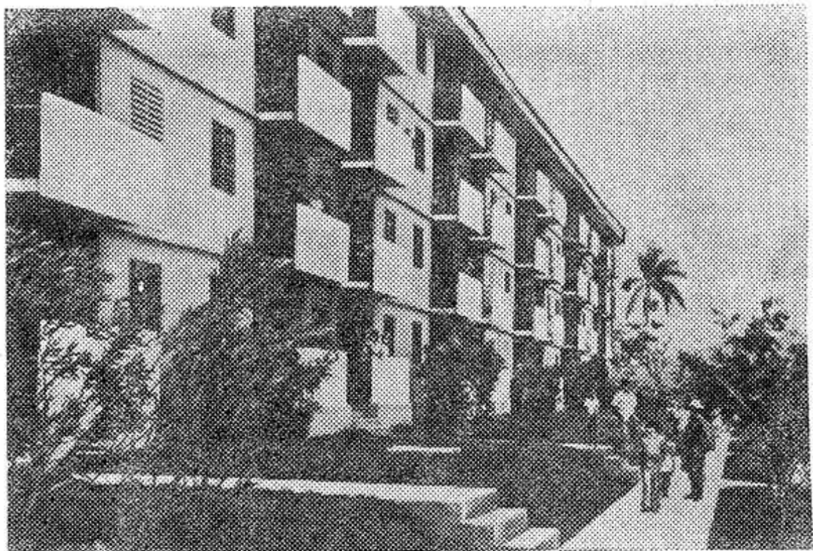
Куба. В отрогах Эскамбрая, в провинции Лас-Вильяс, вырос новый поселок Яя. В четырех-пятиэтажных благоустроенных домах живут семьи животноводов. НА СНИМКЕ: в поселке Яя.