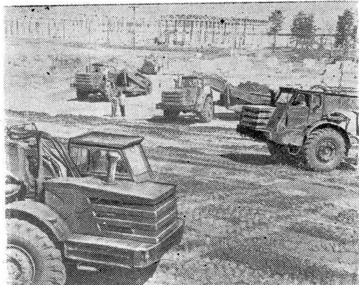
Тольятти. В окрестностях этого волжского города развернулось строительство гигантского комбината плодородия — Тольяттинского азотного завода. Предприятие будет производить аммиачные удобрения. К концу десятой пятилетки этот гигант большой химии вступит в строй. НА СНИМКЕ: на строительной площадке.